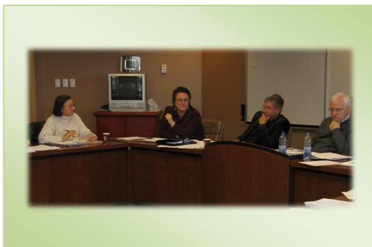
TABLE RÉGIONALE DE CONCERTATION DES PERSONNES ÂNÉES DE L'ABITIBI-TÉMISCAMINGUE