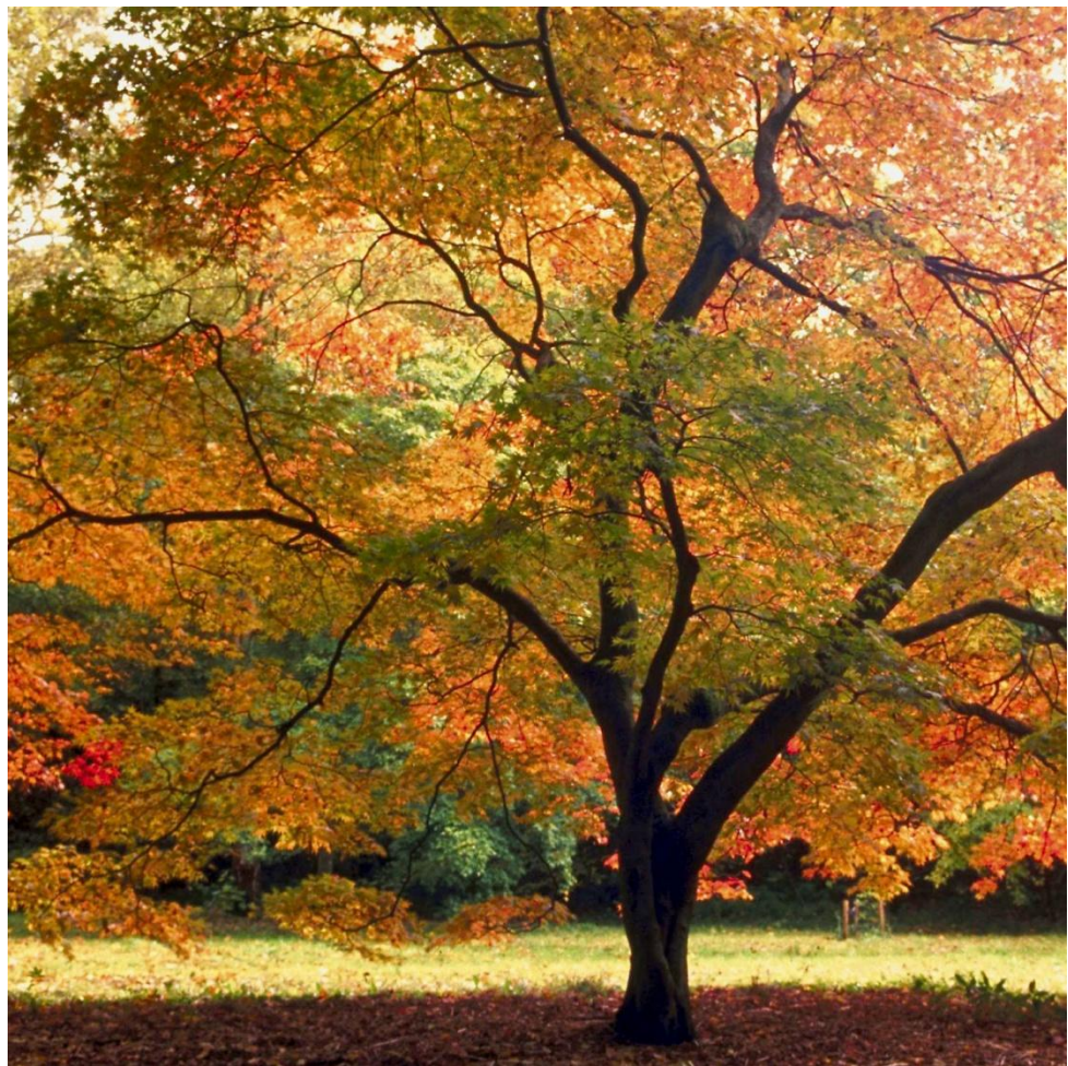
TABLE RÉGIONALE DE CONCERTATION DES PERSONNES AÎNÉES DE L'ABITIBI-TÉMISCAMINGUE