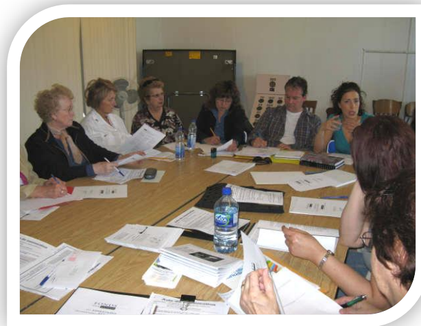
Rencontre de la Table des aînés d'Abitibi-ouest

Faire connaître la mission et les besoins de la Table régionale et connaître les besoins des Tables territoriales