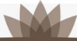
TABLE RÉGIONALE DE CONCERTATION DES PERSONNES AÎNÉES DE L'ABITIBI-TÉMISCAMINGUE